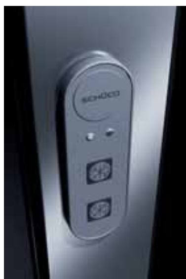
Einfache Bedienung auf Knopfdruck ist gewährleistet