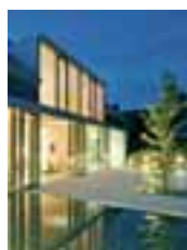
Schiebeelemente für Fenster und Türen Seite 6

Türen zum Schieben und Falten schaffen Durchgänge, schöne Ausblicke und setzen Akzente – im privaten Wohnhaus, in Büro- und Verwaltungsgebäuden sowie im Hotel- und Gastronomie-gewerbe. Ihr platzsparendes Design ermöglicht neue, großzügige Raumkonzepte.