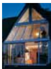
Parallel-Abstell-Schiebe-Kipp-Türen Seite 8