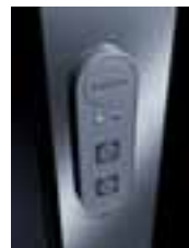
Automatische Schiebeelemente Seite 10