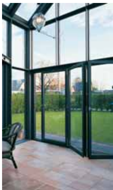
Gedämmte Falt-Schiebetüren für den Außenbereich

Schiebetür die beste Wahl. Zur Erweiterung von Geschäfts- und Büroräumen oder in Passagen kann die Türanlage komplett geöffnet werden.