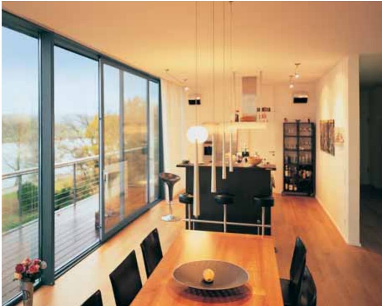
Mehr Licht und Raum zum Wohlfühlen

Wer wünscht sich nicht, mit ein paar schnellen Griffen den Wohn- bzw. Arbeitsraum zu erweitern. Schiebe- und Faltschiebetüren eröffnen ungeahnte Freiräume: Der Wintergarten wird eins mit dem Garten, Balkon und Terrasse verschmelzen mit dem Wohnraum, und auch bei großflächigen Glaskonstruktionen im gewerblichen Bereich bieten Schüco Schiebesysteme vielfältige neue Gestaltungskonzepte im Innen- wie im Außenbereich.