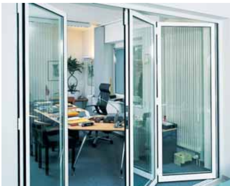
Ungedämmte Falt-Schiebetüren für den Innenbereich