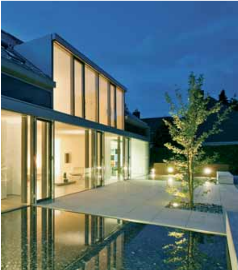
Transparenter Übergang von Haus und Natur

Sie benötigen eine Tür, die sich bei Bedarf einfach zur Seite schieben lässt und großzügige Durchgänge bis zu zwei Dritteln der Elementbreite schafft? Schüco Schiebetüren rollen kinderleicht und nahezu geräuschlos auf korrosionsfreien Edelstahl-Laufschienen.