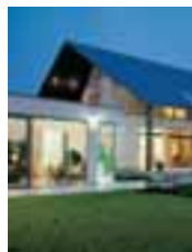
Hebe-Schiebetüren Seite 7