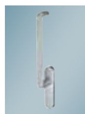
Griff-Designlinie und Systemübersicht Seite 11

Schiebeelemente schaffen großzügige Freiräume