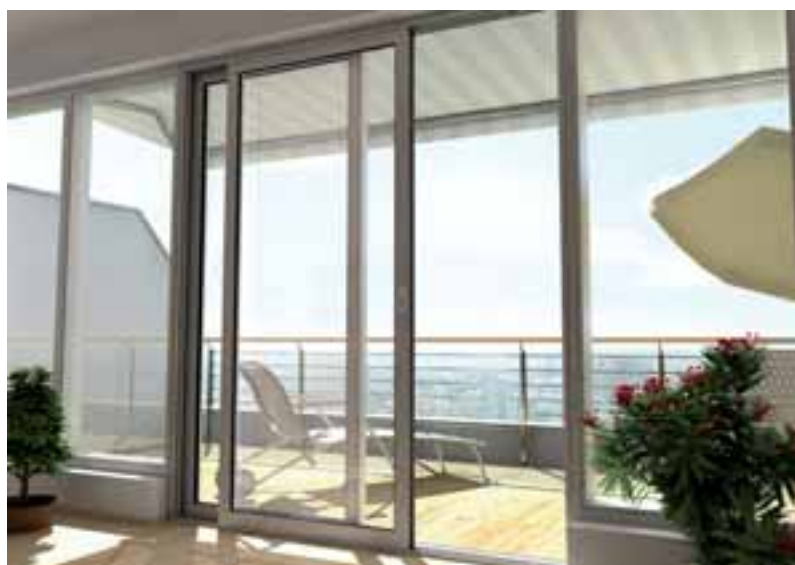
Dezentes Design kombiniert mit intelligenter Technik

Schüco e-slide gibt es vollautomatisch für Schiebe- und für Hebe-Schiebe-Anlagen. Dank einer „intelligenten“ Software verfügt der e-slide-Antrieb über einen integrierten Klemmschutz.