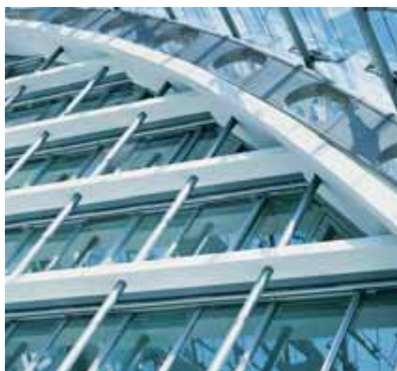
Schiebefenster Lichtdurchflutete Innenräume für Büro- und Verwaltungsgebäude