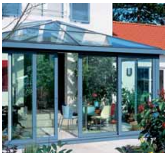
Wintergärten mit Schiebeelement als Bindeglied von Haus und Garten