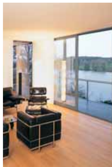
Loftwohnung mit exklusivem Ausblick