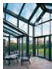
Faltschiebetüren Seite 9