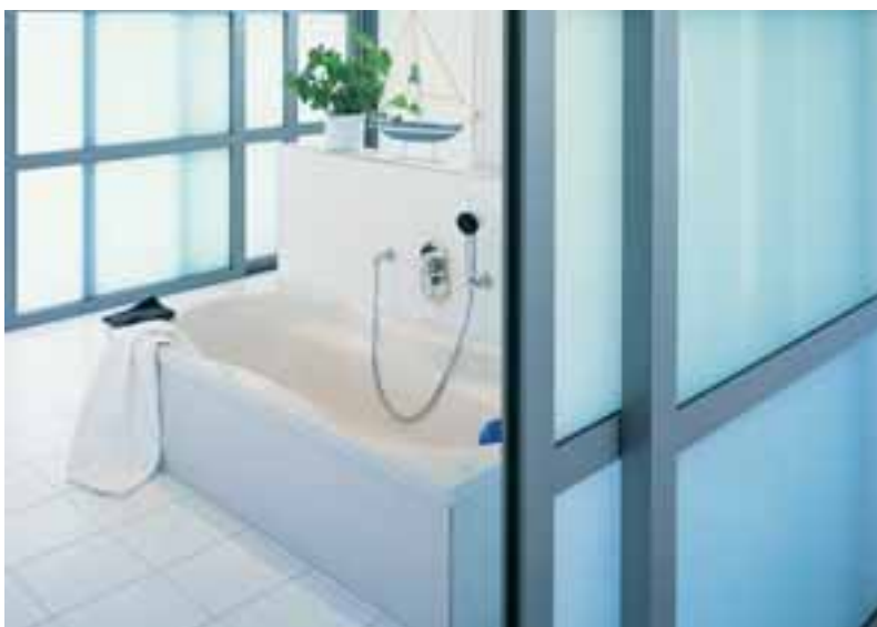
Mehr Wohnkomfort mit Schiebeelementen im Innenbereich

Was für das eigene Haus gilt, kann auch im gewerblichen Bereich eingesetzt werden. Schiebeelemente sind vor allem dann ideal, wenn es um transparente und flexible Raumaufteilung im Innenbereich geht. Die Farb-Vielfalt ist so groß, dass Sie garantiert die zur Einrichtung passende Farbe finden.