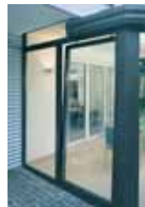
PASK-Tür in Kippstellung