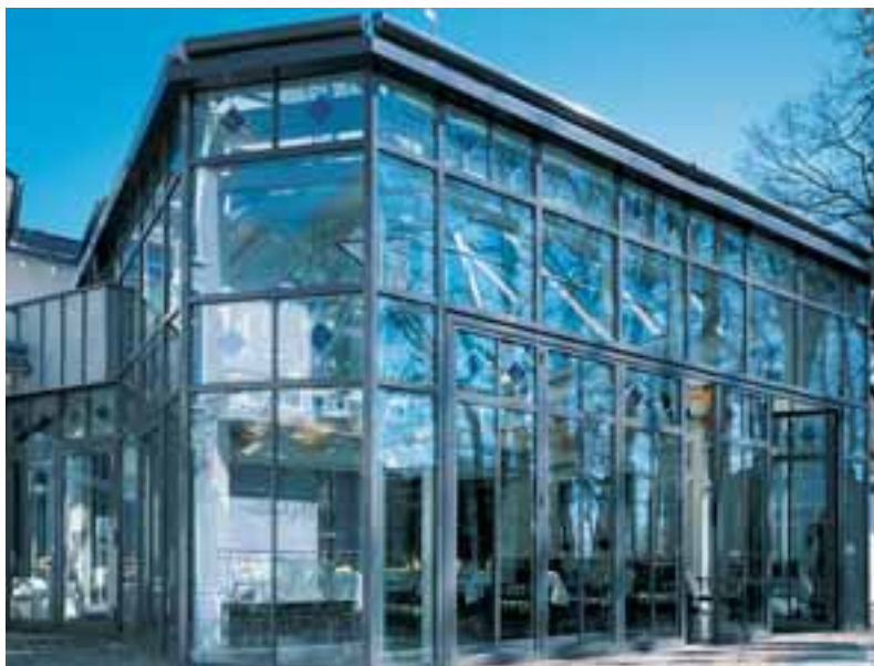
Mehr Genuss für die Gäste im Hanseatic-Hotel Rügen

Die Flügelpakete dieser wärme- gedämmten Tür können Sie kinderleicht nach innen oder außen falten bzw. nach rechts und/oder links verschieben. Die Flügel rollen dabei fast geräuschlos auf Laufwagen. Sie werden oben und unten sicher geführt. So schaffen Sie in Ihrem Zuhause oder auch im Gastronomie- und Veranstaltungsbereich eine perfekte Verbindung zwischen Außen- und Innenbereich.