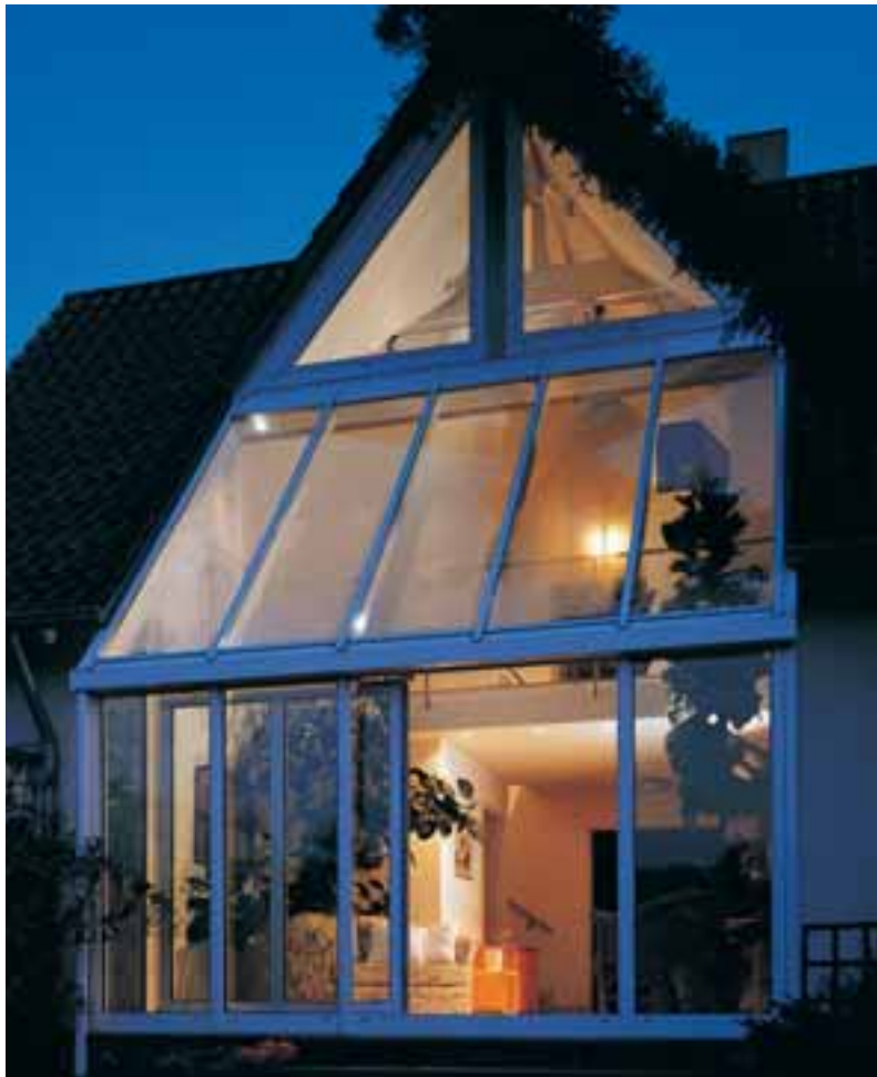
PASK-Tür im Wintergarten

Außen elegant flächenbündig und innen aufschlagend liegen PASK Flügel in den Rahmenelementen und bieten so optimale Dichtigkeit.