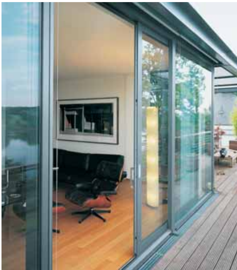
Schiebetüren Freier Zugang zu Balkon und Terrasse

Erfüllen Sie sich Ihre Träume. Keine sperrigen Türen, die in den Raum ragen, keine Fensterflügel, die beim Öffnen wertvolle Stellflächen rauben. Völlig mühelos gleitet eine Glasfläche zur Seite und löst die Grenzen zwischen innen und außen auf.